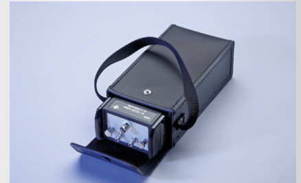
Tragetasche EMA 84 Best.-Nr. 9063.0001 (ohne LCD-Sichtfenster) Best.-Nr. 9064.0001 (mit LCD-Sichtfenster)

Silikonschlauch ID 5 mm, AD 9 mm, rot (Länge bitte angeben)