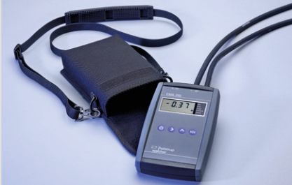
Umhängetasche EMA 200 Best.-Nr. 9074.0001