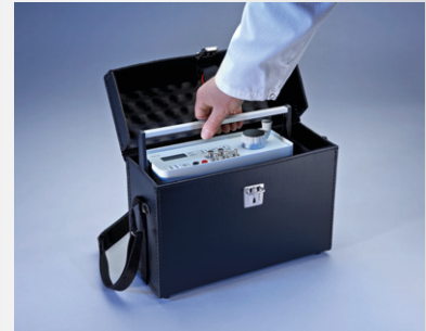
Borsa KAL 84 Codice art. 9062.0001