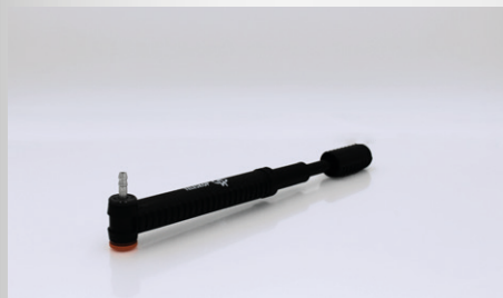
Pompa manuale KAL 84 Codice art. 9601.0036